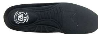
Plantilla extraíble comfortable