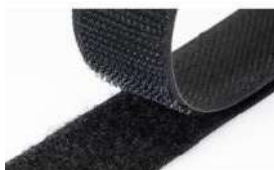
Cierre de Velcro