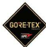
Membrana del forro impermeable + transpirable