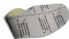
Plantilla anti-perforación flexible