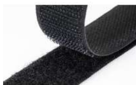
Tira de Velcro