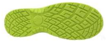
Suela Antiestática + Resistente a los hidrocarburos