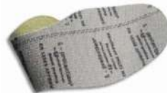
Plantilla anti-perforación flexible