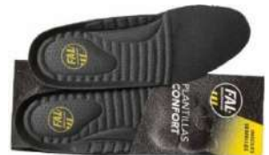
Plantillas extraíbles. Lavables