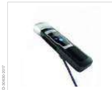
Rosca de 1/4" para acoplar un palo de selfie