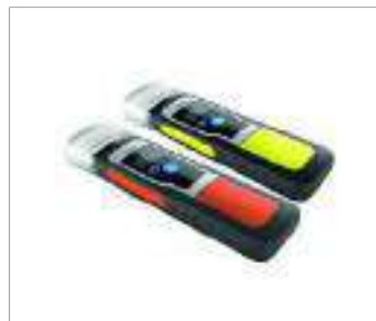
Juego opcional de láminas reflectoras (amarillas o naranjas)