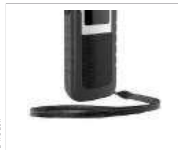
Empuñaduras y correas para la muñeca para una sujeción segura