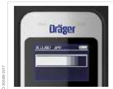
Símbolo "Prueba en curso"