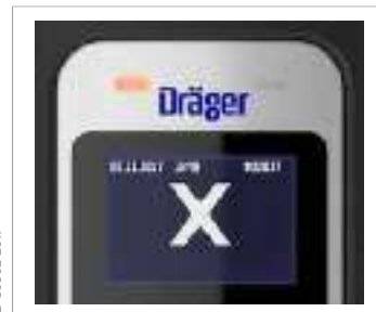
Símbolo "Alcohol detectado"