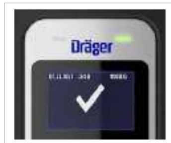
Símbolo "Alcohol no detectado"