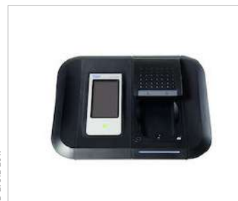
Funda protectora de goma