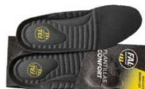
Plantillas extraíbles. Lavables