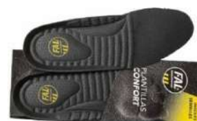
Plantillas extraíbles. Lavables