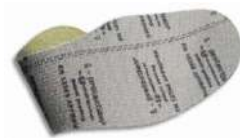
Plantilla anti-perforación flexible