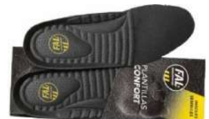
Plantillas extraíbles. Lavables