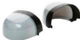
Puntera no metálica