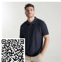
PEGASO PREMIUM PO6609