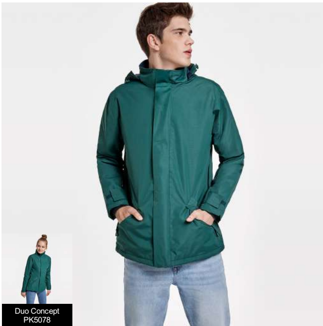
Duo Concept PK5078