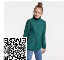
EUROPA WOMAN PK5078