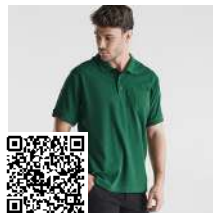
CENTAURO PREMIUM PO6607