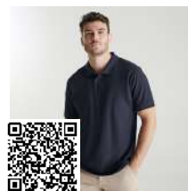
PEGASO PREMIUM PO6609