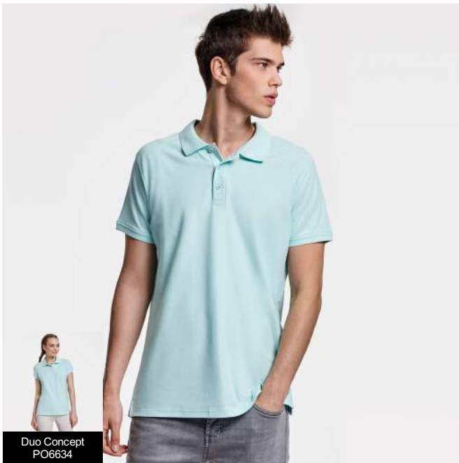
Duo Concept PO6634